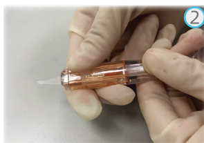
套筒外壳向后拉,折叠人工晶状体